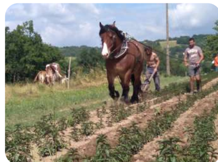
Journée traction animale

Contact : Denis Alamome (denis.alamome@civam.org)