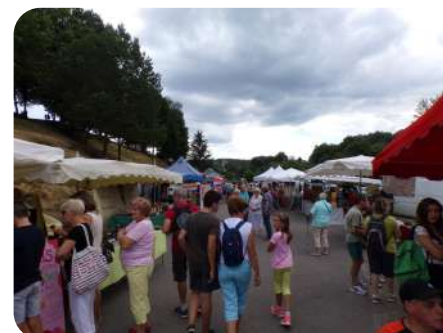
Foire Bio de Ligniac

Depuis Septembre 2018, le groupe CIVAM, Agrobio 19 a embauché une animatrice à temps plein. Contact : Margaux Coste, 06 41 34 75 05 - margaux@agrobio19.com.